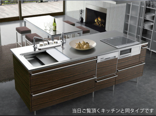
当日ご覧頂くキッチンと同タイプです

開催時間 AM10:00~PM5:00(雨天開催) 会場：鹿児島市桜ヶ丘8丁目 (桜ヶ丘ビュータウン分譲地内)