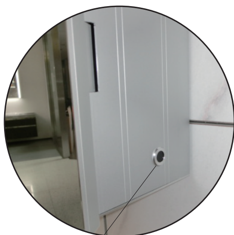
ON/OFF ノータッチセンサー