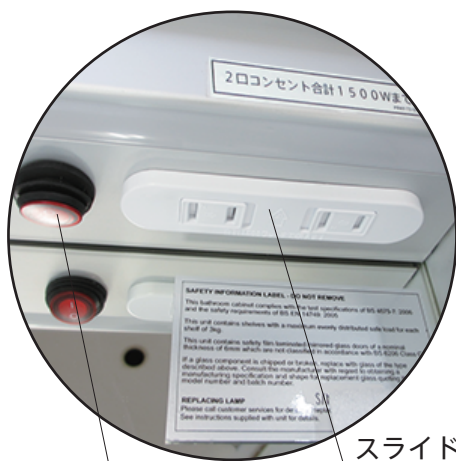
スライド式コンセント ※2口合計1500Wまで コンセント用スイッチ