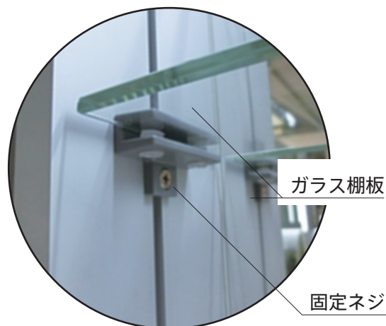
ガラス棚板 固定ネジ