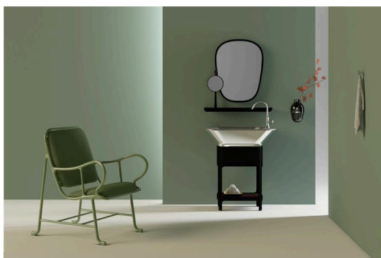
TOP : ステンレスチタン仕上げ SINK : 鏡面仕上げ WIDE : 80cm 価格: 1,178,000 円 (税抜)

株式会社トーヨーキッチンスタイル(代表取締役 渡辺孝雄)は、2014年10月30日よりハイメ・アジョンとのコラボレーションによるオリジナル洗面「MATERICO by Jaime Hayon(マテリコ バイ ハイメアジョン)」を発表します。(後援：スペイン大使館経済商務部)