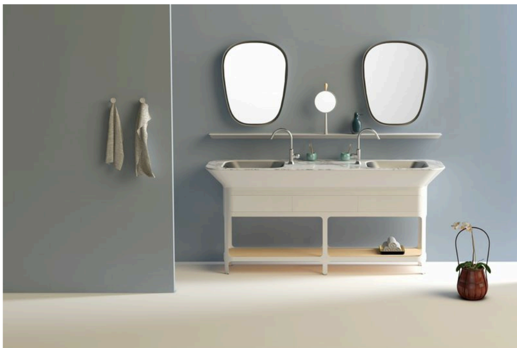
TOP : ホワイトマール SINK : 塗装ホワイト WIDE : 200cm 価格: 1,789,000 円(税抜)

株式会社トーヨーキッチンスタイル(代表取締役 渡辺孝雄)は、2014年10月30日よりハイメ・アジョンとのコラボレーションによるオリジナル洗面「MATERICO by Jaime Hayon(マテリコ バイ ハイメアジョン)」を発表します。(後援：スペイン大使館経済商務部)