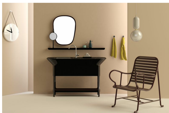
TOP : ブラックマール SINK : 塗装ブラック WIDE : 140 cm 価格: 1,519,000 円(税抜)

「MATERICO by Jaime Hayon」はキャビネット × シンク × ワークトップ の構成となっており、