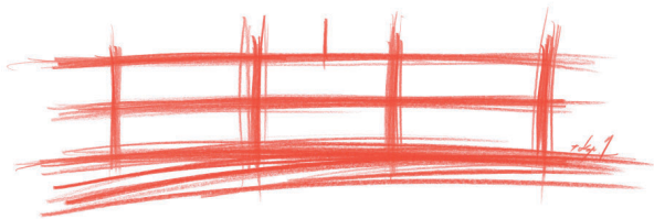
吉岡徳仁による「FINESSE」スケッチ