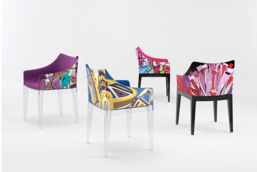
▲MADAME-WORLD OF EMILIO PUCCI EDITION