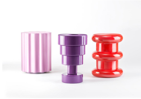
▲Kartell goes SOTTASS A TRIBUTE TO MEMPHIS