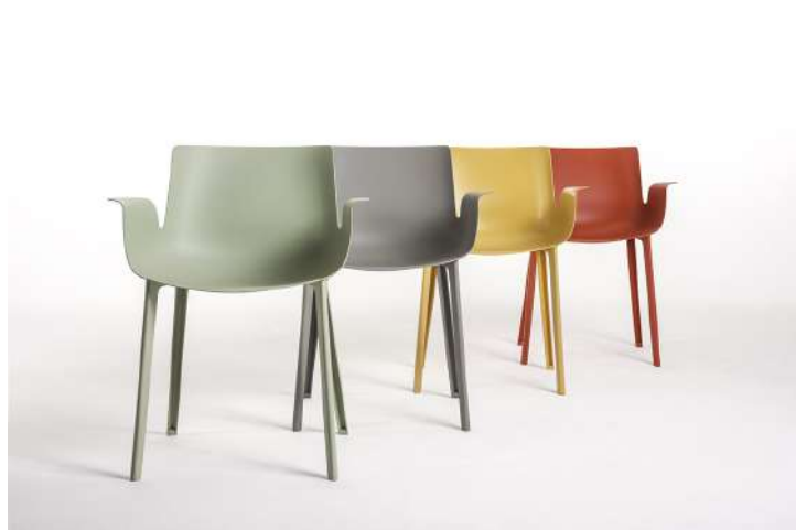
ピウマ | Piuma