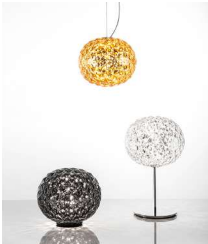
プラネット | Planet

2017年は最新の『カルテル』のインテリアとトーヨーキッチンスタイルのキッチンコーディネートをお届けします。