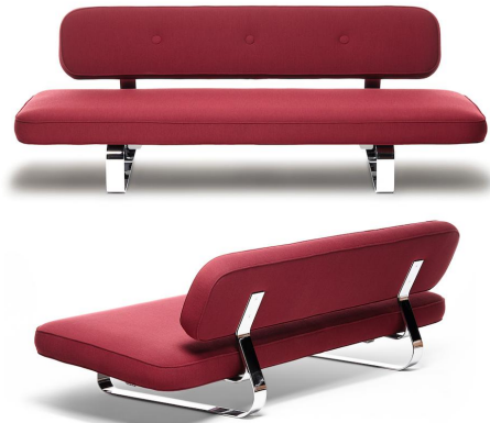
パワーナップ | Power Nap