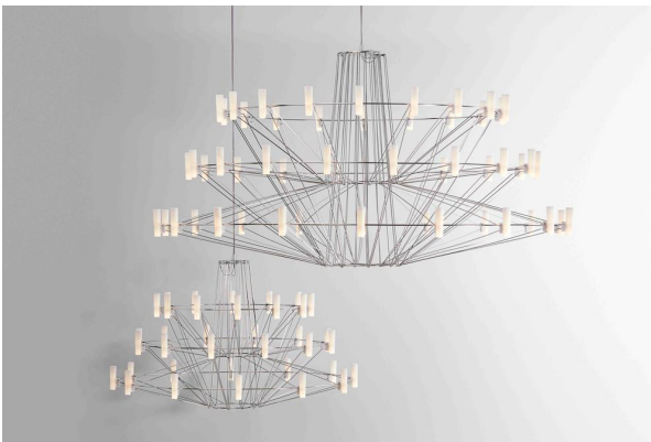
コッペリア | Coppélia

トーヨーキッチンスタイルが日本総代理店を務めるオランダのインテリアブランド「moooi (モーイ)」より、マルセル・ワンダースに見出された唯一の日本人デザイナー 三宅有洋によるシャンデリア「コッペリア」や、マルセル・ワンダースによるラウンジソファ「パワーナップ」など、最新のアイテムが到着。キッチンのトレンドカラーはメタリック、そして住宅は「絶景」がキーワード。2つの要素を併せ持ったキッチン「iNO SPLASH」と世界でもっとも注目されるインテリアブランド「moooi」の織りなす空間をお楽しみください。