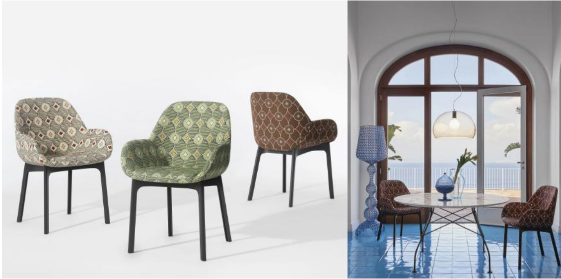
〈左：クラブ ルベリ(クリーム、ピスタチオ、ブラウン) / 右：クラブ ルベリ (ブラウン) 〉

立。アートやデザインコミッション、インテリアデザインのプロジェクトに幅広く取り組んでいます。