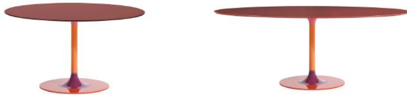
〈左：ラウンド/右：オーバル〉

ティエリーXXLは直径130センチのラウンドと、192センチx118センチのオーバルの2サイズ。カラーはビストロと同じく、バーガンディ、グレイ、ホワイトとブラックの4つのカラーバリエーションからお選びいただけます。