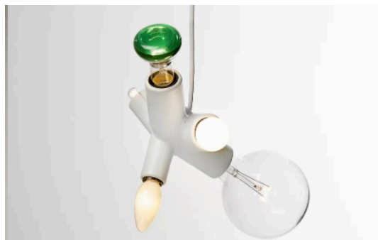
Cluster Lamp | クラスタールンプ