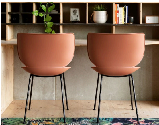
Hana Chair | ハナチェア