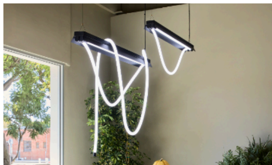
Tubelight | チューブライト