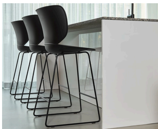
Hana Bar Stool | ハナバースツール