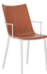
エコフレンドリー生地