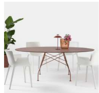
インドアアウトドア 192オーバル