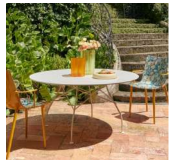
XXLインドアアウトドア 150ラウンド