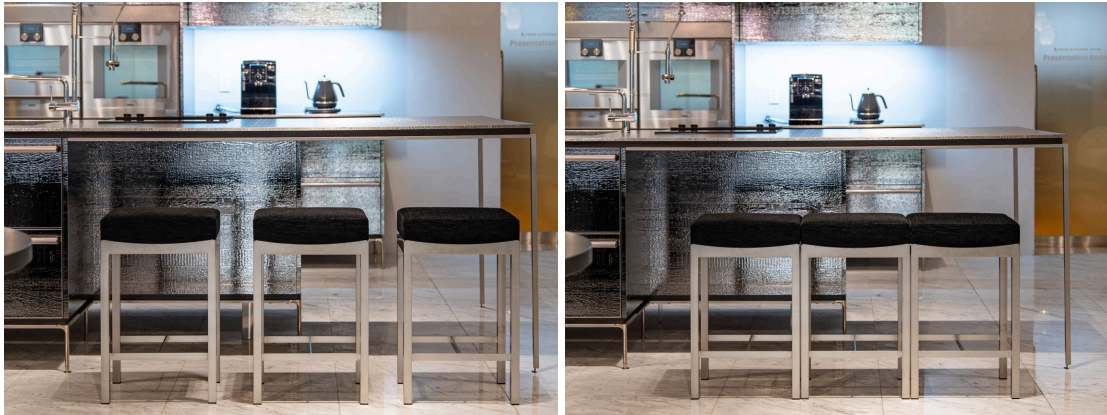
左：一脚ずつ離して置いた場合