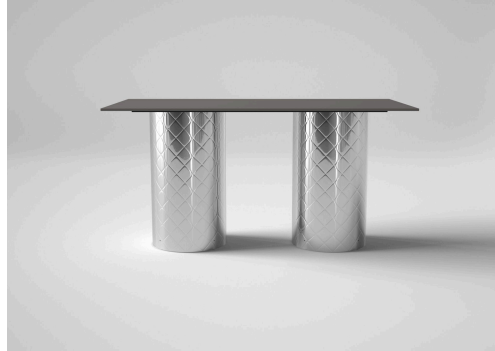
ダブルレッグタイプ