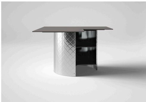
L型ストレージタイプ